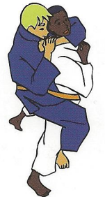
Hadaka-jime Naakte verwurging