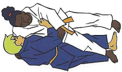
O-oto-gari Grote buitenwaartse maai