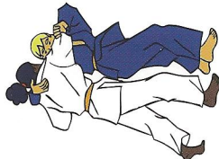
Koshi-guruma Heup wiel