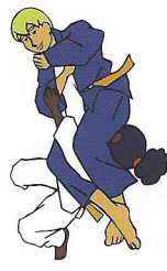
Juj-gatame Gekruiste controle