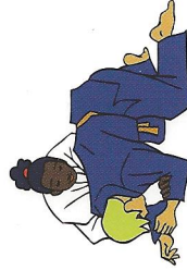
Uke bok Ellebogen/Knieën