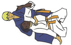
Okuri-eri-jime Beide rewers verwurging