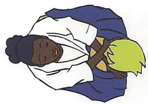
Nami-juji-jime Gewone gekruiste verwurging