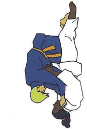
Tori rug Uke tussen benen

2 controletechnieken van elke spelsituatie