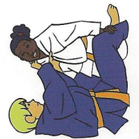
Morote-eri-jime Tweezijdige verwurging