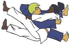
O-goshi Grote heup